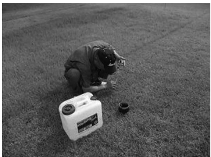
写真3. 簡易透水法による測定

サッチが分解されることで透水 性が向上することから，現場簡易 透水性調査を行った。その方法 は，各試験区にホールカップを打 ち込み，水を施して土壌を飽和状 態にし，水が土壌に浸み込む深さ を時間で測定した。（写真3）調 査開始時は試験区ごとに2箇所 の調査で行っていたが，試験区 内でも場所による違いがあると 判断したため，2014年9月調 査から，各試験区で4箇所を測 定し，平均の数値で表した。結 果を表1，図1に示す。