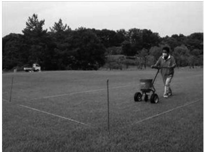
写真1. サイクロンによる施肥作業

この刈込機械の特長には刈り取 った芝草を集草できるため，刈 りカスの取りこぼしが少ない利 点がある。（写真2）